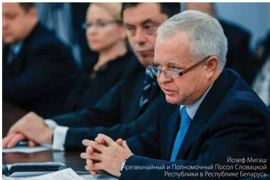
Йозеф Мигаш Чрезвычайный и Полномочный Посол Словацкой Республики в Республике Беларусь

В преддверии Международного белорусско-словацкого предпринимательского форума «Инновации – путь к успешной интеграции» эксклюзивное интервью газете «Гостинный двор» предоставил Йозеф Мигаш, Чрезвычайный и Полномочный Посол Словацкой Республики в Республике Беларусь.