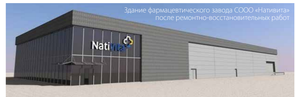
Здание фармацевтического завода ООО «Нативита» после ремонтно-восстановительных работ

торской компании ООО «Витвар», так же в проекте участвуют лидер по разработке и производству первых генерических препаратов в Индии LTD «Натко Фарма», словацкая компания АО «Вита Фарма» и литовская инвестиционная компания «Жиа Валда». Стратегическим партнером проекта является российская компания ЗАО «Биокад».