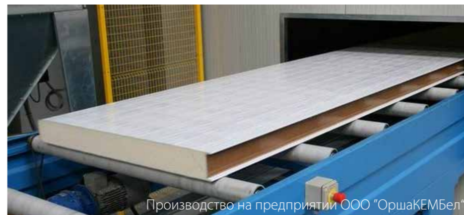
Производство на предприятии ООО «ОршаКЕМБел»

За 2016-2020 годы на экспорт планируется поставить высокотехнологичной и наукоемкой продукции на сумму порядка 700 млн. долларов США.